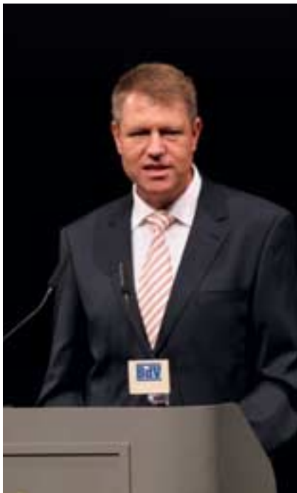
Klaus Johannis dankt für die Auszeichnung

Das hat nicht verhindert, dass auch die Deutschen Rumäniens in den Zweiten Weltkrieg und in dessen Folgen voll hineingerissen worden sind;