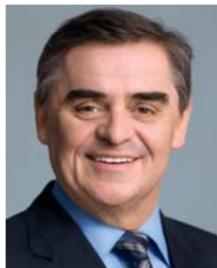
Peter Müller Ministerpräsident des Saarlandes

Allen Mitgliedern, die sich aktiv für die Bewältigung der Vergangenheit einsetzen, spreche ich an dieser Stelle meinen Dank und meine hohe Anerkennung für ihre vielfältigen Bemühungen aus.