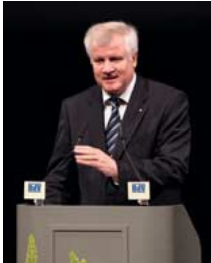
Horst Seehofer, Bayerischer Ministerpräsident

Die Integrationsprobleme heute liegen auf einer ganz anderen Ebene als die Integrationsprobleme nach dem zweiten Weltkrieg. Dass es viele Probleme gibt, ist wahrlich nicht zu leugnen. Man muss sie offen ansprechen, aber nicht nur ansprechen, sondern auch anpacken, was im übrigen unsere Gesellschaft mit hohem ideellem und materiellem Einsatz tut. Es gibt viele Beispiele für gelungene Integration, aber wir sollten aufhören, wenn etwas nicht klappt, wenn Integration misslingt, die Schuld und das Versagen immer nur bei uns zu suchen. Wir fördern Integration, aber wir fordern sie auch ein: Wer zu uns kommt, von dem können wir auch erwarten, dass er von sich aus alle Anstrengungen unternimmt, sich in unser Sprach-, Rechts- und Wertesystem zu integrieren.