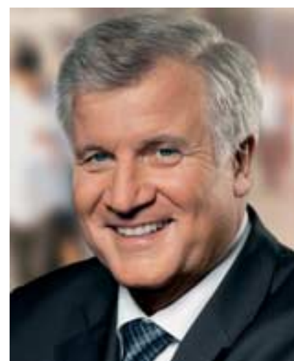
Horst Seehofer Ministerpräsident des Freistaats Bayern

Man muss sich für einen Moment in die damalige Zeit hineinversetzen, um die visionäre und ideengeschichtliche Kraft der Charta würdigen zu können. Flucht und Vertreibung lagen erst drei, vier, fünf Jahre zurück. Die meisten Heimatvertriebenen lebten noch mittellos in Lagern. Verwandtschaften und Gemeinschaften waren zerrissen. Über 2 Millionen Tote waren zu beklagen und betrauern. Der Eisernen Vorhang senkte sich mitten durch Europa und mitten durch Deutschland hinnieder.