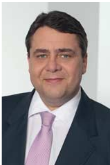
Sigmar Gabriel Vorsitzender der Sozialdemokratischen Partei Deutschlands

Sie haben Ihre Festveranstaltung unter das Leitwort „Durch Wahrheit zum Miteinander“ gestellt. Dabei ist Wahrheit ein großes Wort. Sie ist umfassend, untrennbar, zeitlos und grenzüberschreitend. Oft tut sie weh. Wie schmerzvoll die Wahrheit sein kann, wissen die Vertriebenen Europas des letzten Jahrhunderts, wissen wir in diesen Tagen, wenn wir die Bilder des gefundenen Massen-