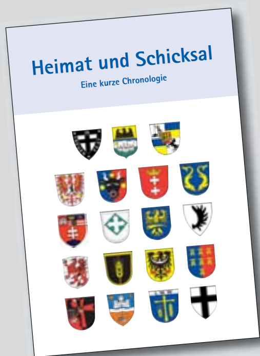
Heimat und Schicksal Eine kurze Geschichte der Landsmannschaften im BdV und ihrer Herkunftsgebiete

Vertriebene Aussiedler Spätaussiedler Tatsachen und Argumente