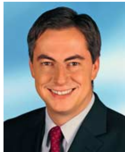
David McAllister Ministerpräsident von Niedersachsen

Der Verlust der Heimat prägt einen Menschen ein Leben lang und lässt sich nur schwer verwinden. Das Schicksal der Heimatvertriebenen war von unermesslichem Leid begleitet und viele quälen sich mit den Schrecken dieser Zeit bis heute. Aber gleichzeitig haben sie nie aufgegeben und die Hand zur Versöhnung gereicht. In einer Inschrift am Heimkehrerdenkmal im niedersächsischen Friedland heißt es: „Völker entsaget dem Hass – versöhnt Euch, dienet dem Frieden – baut Brücken zueinan-