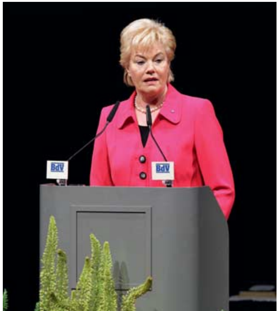
BdV-Präsidentin Erika Steinbach MdB begrüßt die Ehrengäste

Der Wert unserer Charta lässt sich nur ermessen, wenn man sich in ihre Zeit hineinbegibt, nicht aus unserem Wohlstandsgefüge heraus das von oben herab mit viel Arroganz betrachtet und sagt, ihr hättet das for-