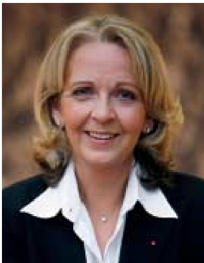
Hannelore Kraft Ministerpräsidentin des Landes Nordrhein–Westfalen

Auch wenn die heute Heranwachsenden keinen persönlichen Bezug mehr zu Krieg und Nachkriegszeit haben können, ist es unsere Aufgabe, ihnen die damaligen Geschehnisse umfassend und anschaulich nahezubringen. Wir tun das in unseren Schulen unter anderem mit einer Lehrerhandreichung zum Thema Flucht und Vertreibung. Das Erinnern als Nachhall erlebter Leiden wird nicht aufhören, hat Günter Grass einmal mit Blick auf