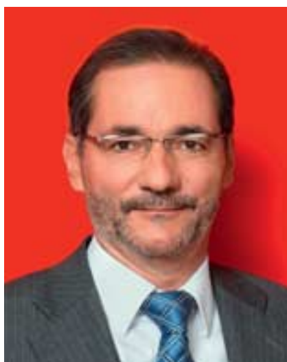
Matthias Platzeck Ministerpräsident von Brandenburg

Der Verlust von Heimat, Hab und Gut ist eine eindrückliche Erfahrung, ein traumatisches Erlebnis, das lange nachwirkt. Leider gehören Flucht und Vertreibung noch immer zu den Erfahrungen, die Menschen auf vielen Kontinenten erleiden. Auch Europa ist davor bis heute nicht gefeit. Umso bedeutender war die Erklärung der „Charta der deutschen Heimatvertrie-