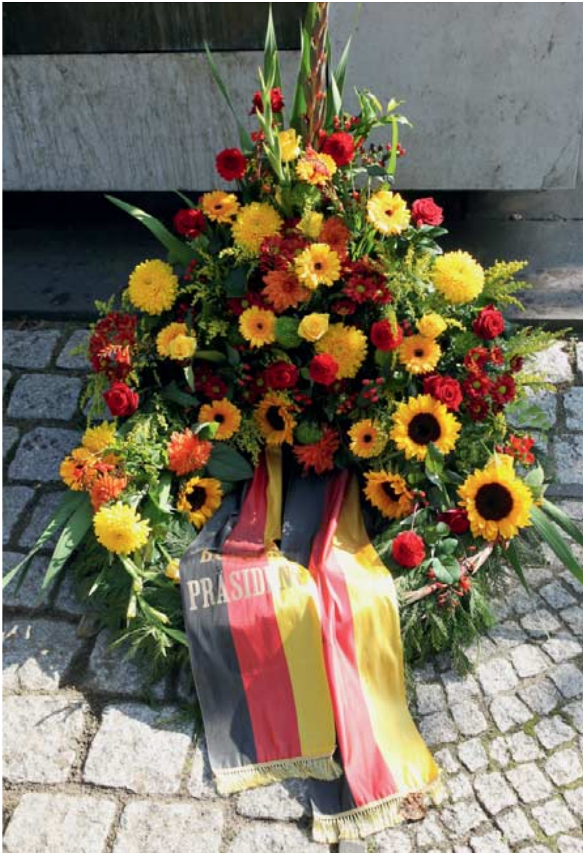
Der Kranz des Bundespräsidenten der Bundesrepublik Deutschland, Christian Wulff