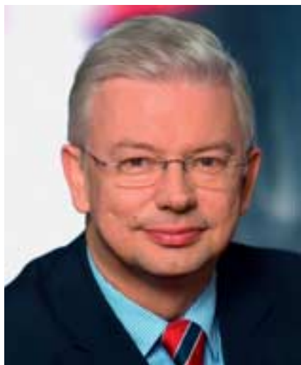
Roland Koch Ministerpräsident von Hessen

stellt, sehen sich die betroffenen Menschen einem dramatischen Eingriff in ihr Leben ausgesetzt. Wir müssen zur Kenntnis nehmen, dass solche Eingriffe zu allen Zeiten und in vielen Teilen der Welt vorkommen. Dies weckt unser Mitgefühl für die Opfer und unsere Empörung gegen die Tat. Unsere Pflicht ist es, den Opfern der Vergangenheit zu gedenken, ihr Leiden zu würdigen und das Unrecht zu benennen. Millionen Deutsche haben in der Mitte des 20. Jahr-