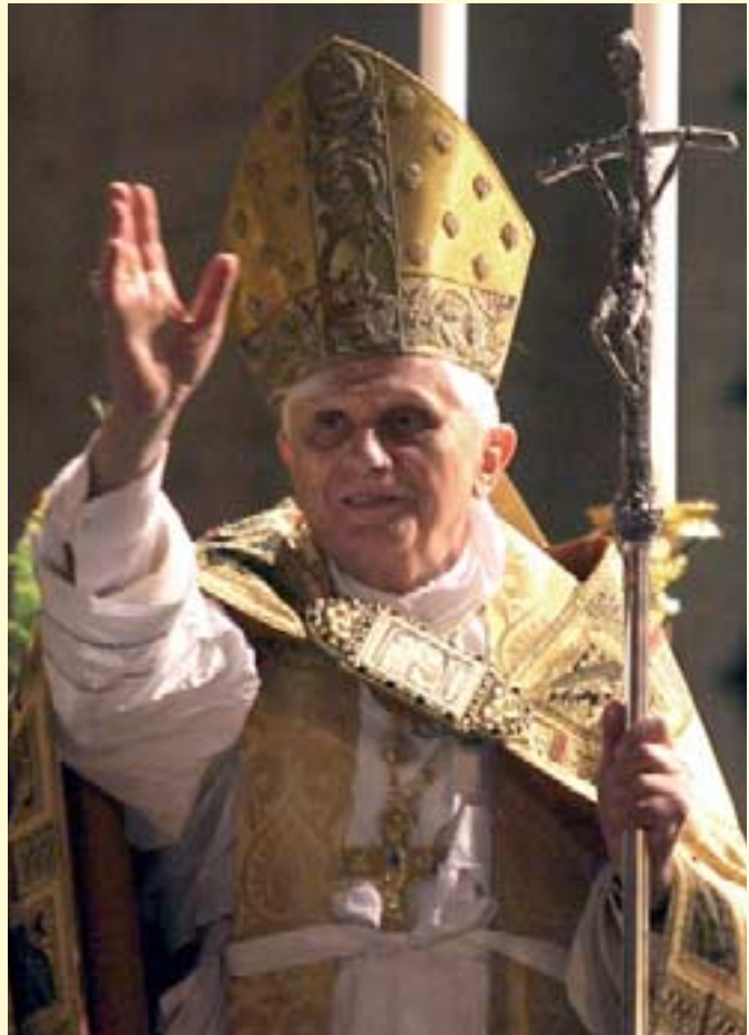
Papst Benedikt XVI.

Das diesjährige Treffen steht unter dem Leitwort „Durch Wahrheit zum Miteinander“. Das Zusammenleben der Menschen kann nur auf der Grundlage der Wahrheit gelingen. Ohne Wahrheit, ohne Vertrauen und Liebe gegenüber dem Wahren gibt es kein Gewissen und keine soziale Verantwortung. Ohne Wahrheit gibt es nur Geschichten aber keine Geschichte.