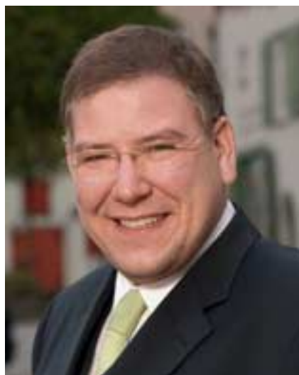
Christoph Ahlhaus Erster Bürgermeister der Freien und Hansestadt Hamburg

Tatsächlich sind in dieser Sekunde Menschen auf der ganzen Welt Opfer von Flucht und Vertreibung. Wer heimatlos ist, der ist seinem Leben entfremdet, der muss sich und seine Biographie fortlaufend rechtfertigen. Der Schriftsteller Stefan Zweig hat dieses Gefühl der Amputiertheit in seinen