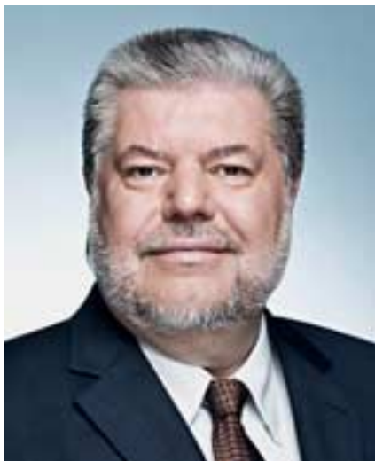
Kurt Beck Ministerpräsident von Rheinland-Pfalz

ne die Verbrechen im Nationalsozialismus wäre die Vertreibung nicht erfolgt. Richard von Weizsäcker hat es in seiner berühmten Rede zum