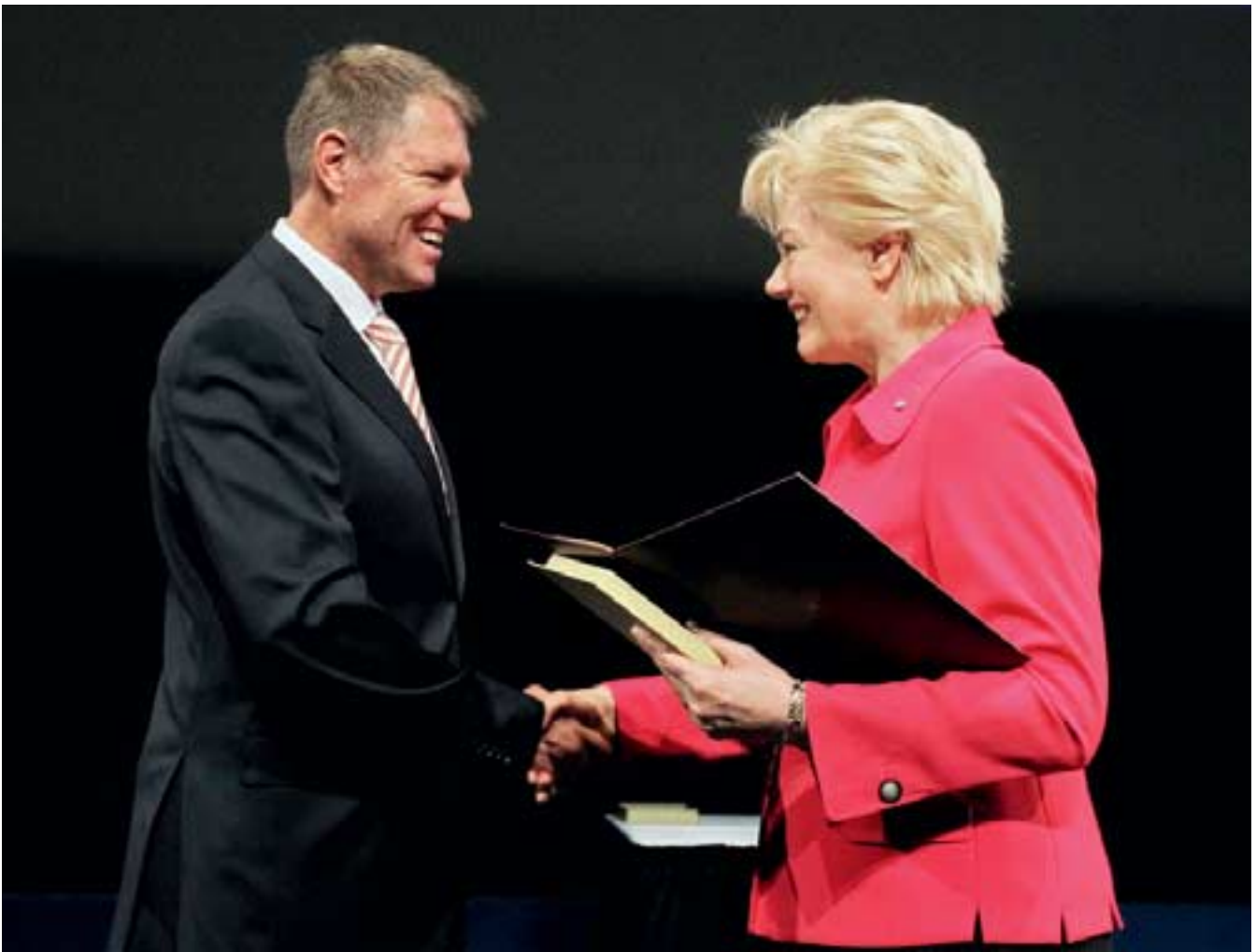
BdV-Präsidentin Erika Steinbach zeichnet den Bürgermeister von Hermannstadt, Klaus Johannis mit der Ehrenplakette aus