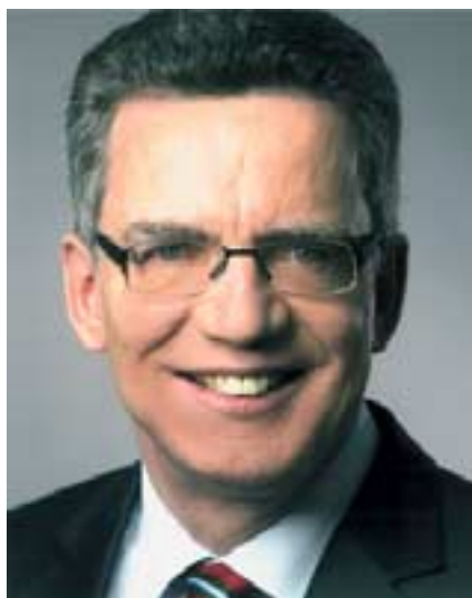
Dr. Thomas de Maizière, MdB

Jedes Jahr gedenken wir mit dieser Veranstaltung der Vertreibungsoffer, die im und nach dem Zweiten Weltkrieg ihre Heimat verloren haben. Wir gedenken auch der Menschen, die wegen des Kalten Krieges erst viel später in den Westen gereist sind, und derjenigen, die in ihrer Heimat geblieben sind. Ferner denken wir an alle Menschen, die bis zum heutigen Tag ihre Heimat unter Zwang verlassen mussten und müssen.