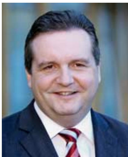
Stefan Mappus Ministerpräsident des Landes Baden-Württemberg

Die Erinnerung an die leidvolle Flucht und Vertreibung deutscher Bevölkerung zum Ende des Zweiten Weltkriegs ist ein Teil unserer Geschichte. Eine wichtige Aufgabe der jüngeren Generationen ist, das Wissen um Kultur und Geschichte der Menschen aus den Vertreibungsgebieten zu erhalten. In Baden-Württemberg haben die Vertriebenen nach dem Ende des Zweiten Weltkrieges vorbildlich in der neuen Umgebung Fuß gefasst und einen wichtigen Beitrag beim Wiederaufbau unseres Landes nach dem Zweiten Weltkrieg geleistet. Die Vertriebenen haben sich in die Gesellschaft integriert und hier eine neue Heimat gefunden, ohne dabei die eigenen landsmannschaftlichen Wurzeln zu vergessen. Das Bekenntnis zur neuen und das Geden-