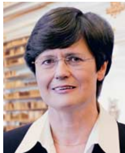
Christine Lieberknecht Ministerpräsidentin des Freistaates Thüringen

Nach Krieg und Vertreibung haben sich die Vertriebenen in der Fremde eingelebt, haben sich trotz aller Härten in die Gesellschaft integriert und beim Wiederaufbau angepackt – und so auch ihre Liebe zur neuen Heimat unter Beweis gestellt. Gerade deshalb haben sie auch ein Anrecht auf die Liebe zu Ihrer alten Heimat. Diese Heimatliebe ist kein Revanchismus, das haben Sie vielfach demonstriert, nicht zuletzt mit der Stuttgarter