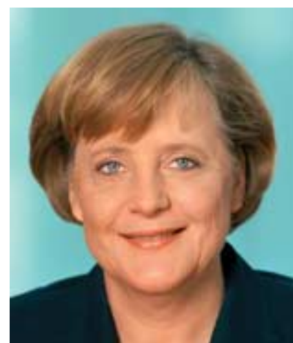
Bundeskanzlerin Dr. Angela Merkel, MdB Vorsitzende der CDU Deutschlands

An das Leid durch Flucht und Vertreibung zu erinnern und dies als Teil der Geschichte wahrzunehmen, ohne jemals Ursache und Wirkung zu verkennen oder die Augen vor dem unvergleichbaren Leid anderer zu verschließen, ist Auftrag und Aufgabe für uns alle. Das Unrecht, das 15 Millionen Vertriebene zum Ende des Zweiten Weltkrieges erleiden mussten, geht uns alle an und darf uns niemals gleichgültig sein. Es bleibt Unrecht.