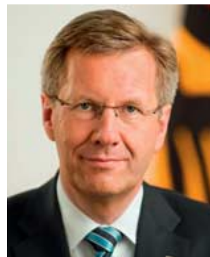
Bundespräsident Christian Wulff

Ich freue mich, dass immer mehr junge Menschen nach Masuren, nach Schlesien oder ins Riesengebirge fahren, um auch dort Wurzeln deutscher Geschichte und Kultur kennen zu lernen. Das vereinte Europa, in dem Grenzen nicht mehr trennen, bringt vielen die Heimat zurück.