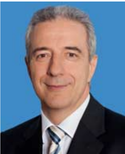
Stanislaw Tillich Ministerpräsident des Freistaats Sachsen

Er sieht sich nicht allein als Fürsprecher der Vertriebenen, sondern auch als Förderer zwischenmenschlicher und zwischenstaatlicher Kontakte zwischen Deutschland und den Gebieten, aus denen Deutsche am Ende des Zweiten Weltkriegs vertrieben worden sind. Der Tag der Heimat ist deshalb nicht nur der Rückschau gewidmet, sondern stärkt auch die gegenwärtigen Beziehungen zu den ehemals deutsch besiedelten Gebieten, die auch von den Enkeln der Vertriebenen als ihre Heimat, als Teil ihrer Identität begriffen werden.