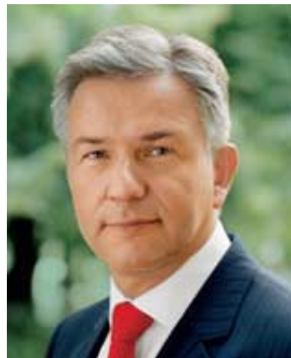
Klaus Wowereit Regierender Bürgermeister von Berlin

Vertreibungen waren im 20. Jahrhundert ein gesamteuropäisches Schicksal. Es ereilte zunächst die