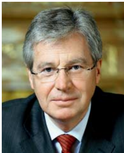
Jens Böhrnsen Bürgermeister und Präsident des Senats der Freien Hansestadt Bremen

und Enkeln die Bereitschaft mit auf den Weg gegeben, sich für ein friedliches Miteinander der Völker untereinander einzusetzen.