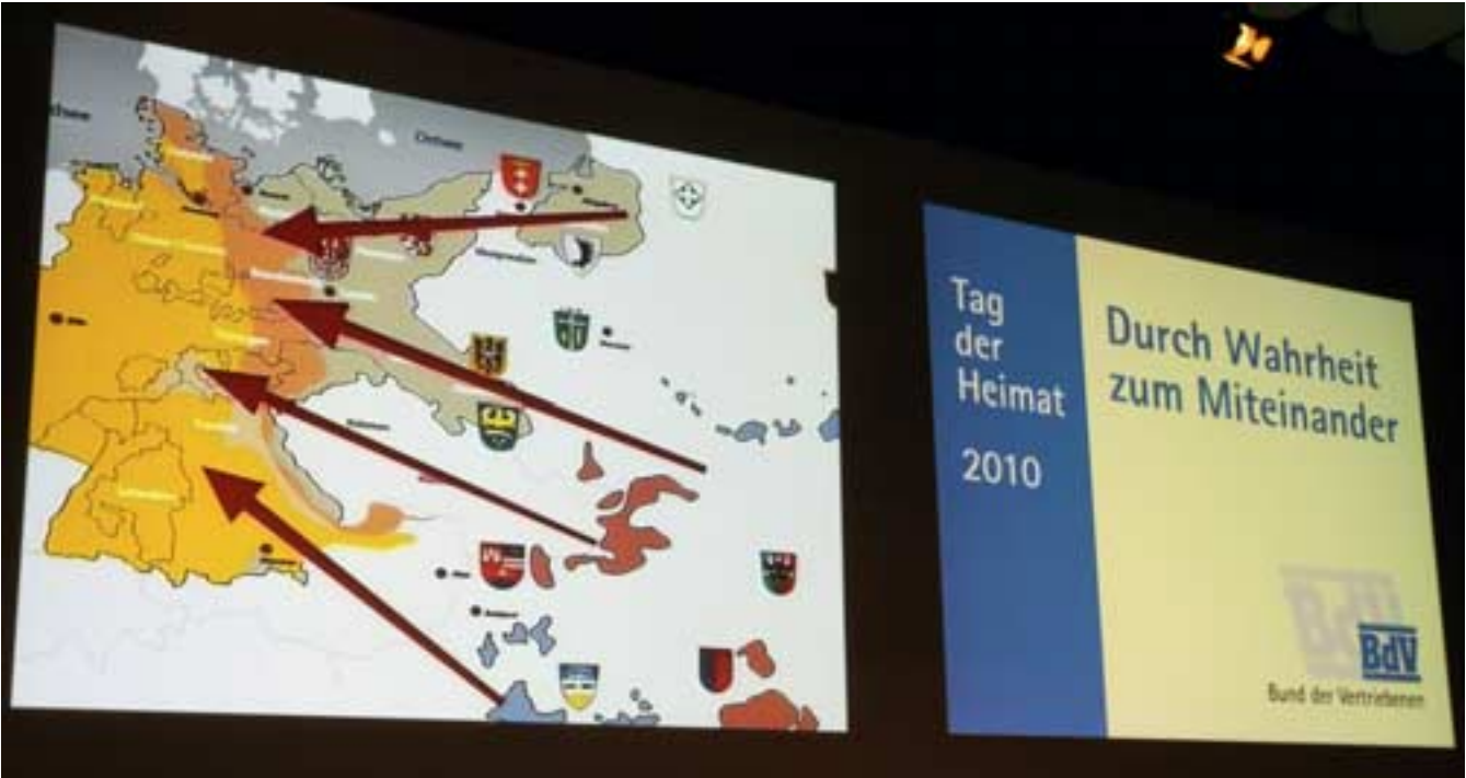
Ausschnitte aus dem Film über die Charta der Heimatvertriebenen