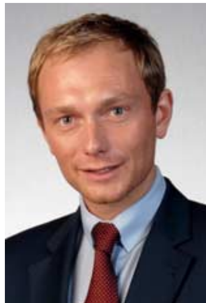
Christian Lindner MdB Generalsekretär der Freien Demokratischen Partei

Mit dem Motto Ihrer Veranstaltung „Durch Wahrheit zum Miteinander“ stellen Sie sich ganz bewusst in die Tradition der 1950 verabschiedeten Charta der Heimatvertriebenen, die Versöhnung in den Mittelpunkt ihres Handelns stellt.