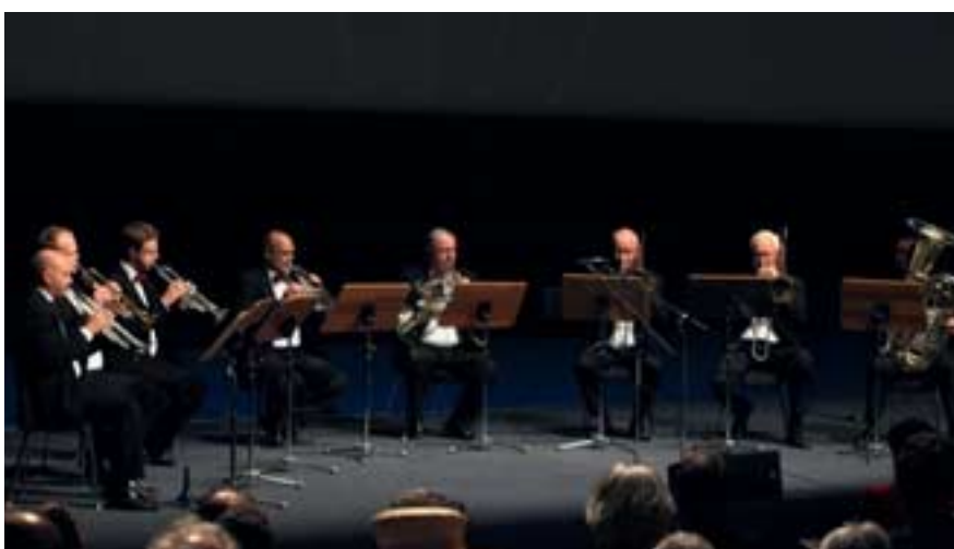
Der Festakt wurde wieder musikalisch von den Potsdamer Turmbläsern umrahmt.