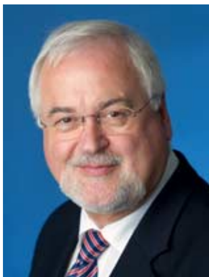
Peter Harry Carstensen, Ministerpräsident des Landes Schleswig-Holstein

65 Jahre nach Kriegsende ist dieses Thema keines, unter das man einen Schlussstrich ziehen könnte. Vielmehr beobachten wir ein neues Interesse der Enkelgeneration an den damaligen Ereignissen. Schon vor 25 Jahren hat Richard von Weizsäcker in seiner Rede zum Jahrestag des Kriegsendes gesagt: „Jüngere und Ältere müssen und können sich gegenseitig helfen zu verstehen, warum es lebenswichtig ist, die Erinnerung wach zu halten.“