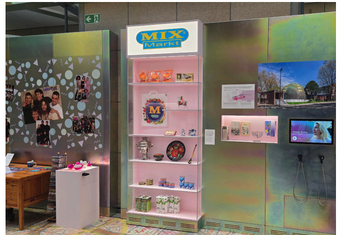
Russlanddeutsche – als einzige genannte Aussiedlergruppe – werden unter dem Logo der Mix-Märkte zusammengefasst.

Insgesamt muss das Urteil über die neue Dauerausstellung im Haus der Geschichte deutlich kritisch ausfallen. Es überzeugen die moderne Gestaltung, interaktive Formate und die klare Ansprache jüngerer Besucherinnen und Besucher, aber zugleich werden die Erfahrungen von Vertriebenen, Aussiedlern und Spätaussiedlern relativiert und in einer allgemeinen Migrationsgeschichte „verflacht“. Zentrale Themen der alten Ausstellung – Flucht, Vertreibung, Integration, die Rolle der Vertriebenenverbände und die Kontroversen zum Beispiel um