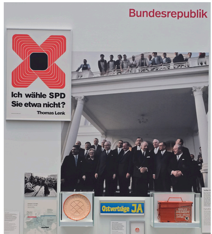
Die Tafel zur Ostpolitik und den Ostverträgen mit dem „Schmuckteller“, der den Text „Gott gib uns die Heimat wieder“, der die Haltung der Vertriebenen symbolisieren soll.

Was ebenfalls fehlt, ist die Geschichte der Aussiedler und Spätaussiedler. Das sind etwa 4,5 Millionen Menschen, deren Biografien ebenfalls ausgeklammert sind. Auch die Grundlage ihres Zuzugs in die Bundesrepublik Deutschland, nämlich das Kriegsfolgenschicksal, bleibt unerwähnt. Die Deutschen